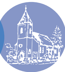
St. Johannes-Gemeinde Rodenberg