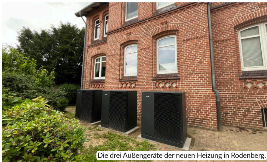
Die drei Außengeräte der neuen Heizung in Rodenberg.