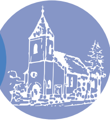
St. Johannes-Gemeinde Rodenberg