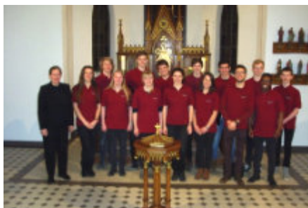
Jugendchor SELK Nord

aus den norddeutschen Gemeinden der SELK im Alter zwischen 13 und 23 Jahren. Der Chor musiziert klangvolle Werke unterschiedlicher Epochen für Chor a capella und Kompositionen mit Instrumenten.