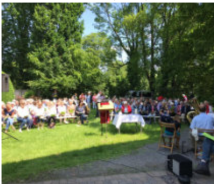
Ökumenischer Gottesdienst Pfingstmontag

Eine Besonderheit in diesem Jahr beim Gottesdienst zum Schützenfest: Ein neuer Altar für diesen jährlichen Gottesdienst – gebaut und gestiftet von der Firma Weikert – wurde geweiht.