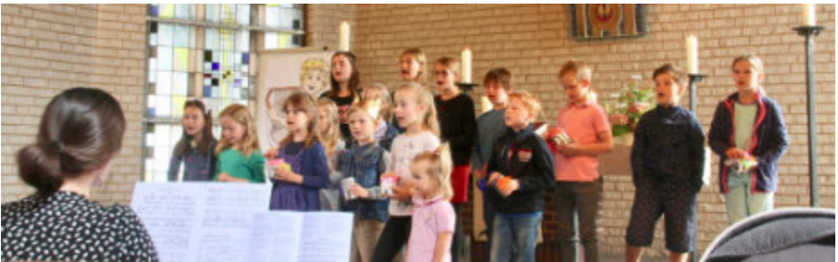
Kindermusical – Foto: von Hering