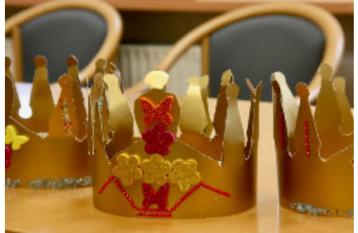
gebastelte Kronen der Kinderbibelwoche

Wir als Kirchenvorstand meinen, dies ist der geeignete Moment, noch einmal in sich zu gehen und zu überlegen, wie wir zu der Berufung stehen und welche Gedanken wir hierzu haben und möchten Sie gerne ermuntern, Ihre Gedanken dazu mit den Kirchenvorstandsmitgliedern zu teilen. So hoffen wir, dass im Oktober niemand diese Entscheidung mit ungeklärten Fragen oder einem ungunten Gefühl treffen muss. Auch möchten wir Ihnen gerne die Möglichkeit geben, Dinge anzusprechen, für die eine Gemeindeversammlung nicht der geeignete Rahmen wäre.